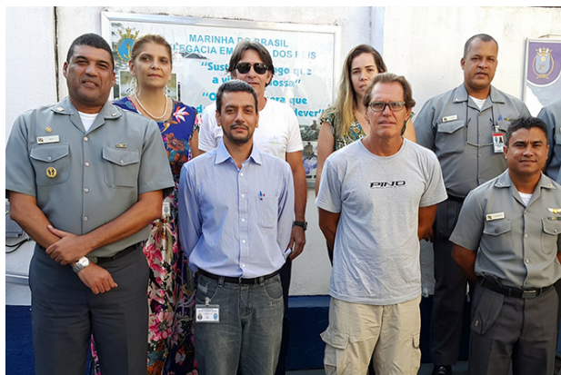
TurisAngra busca uma solução rápida

Decisão da Capitania dos Portos, que afeta saveiros e escunas, visa garantir a segurança de banhistas