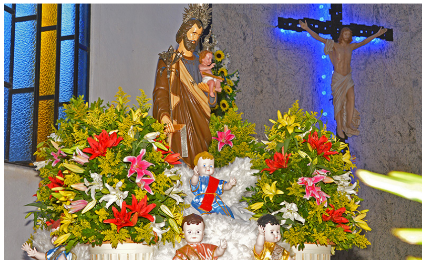
São José Operário será celebrado