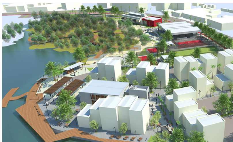
Projeto para a praia da Chacara

Projetos da secretaria de Meio Ambiente poderão revolucionar a cidade