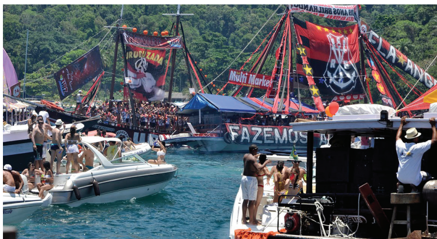
Procissão Marítima de Ano Novo reuniu mais de 400 embarcações