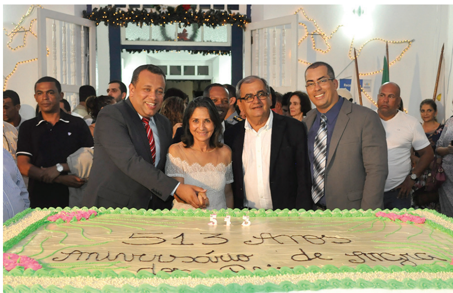
Corte do bolo: ponto alto das comemorações pelo aniversário de Angra

Festa teve corte de bolo, queima de fogos e população comemorou com muita paz