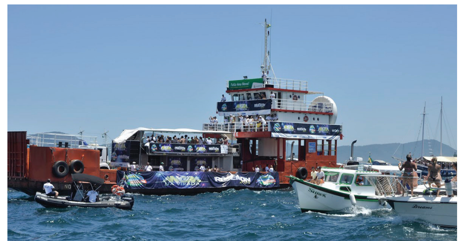
Trio elétrico no mar voltou a fazer parte da festa e animou os foliões