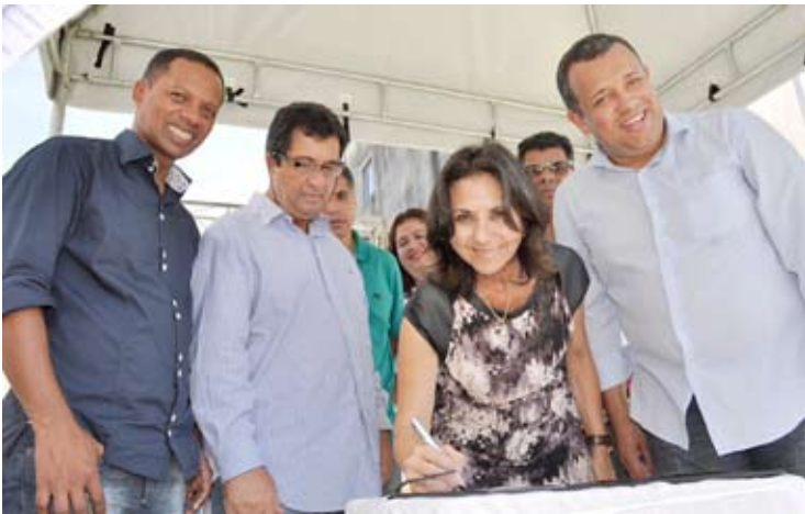
Assinatura da ordem de serviço foi feita pela prefeita

Ampliação de unidade escolar é uma das melhorias que a prefeitura está levando para o bairro