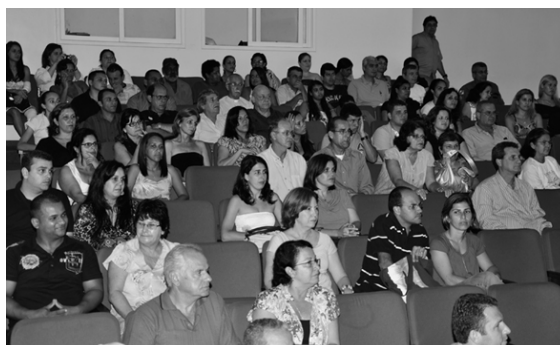
Na plateia, os homenageados e seus familiares