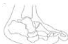
Artropia de Charcot