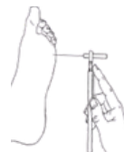
Aplicação do monofilamento 10g.